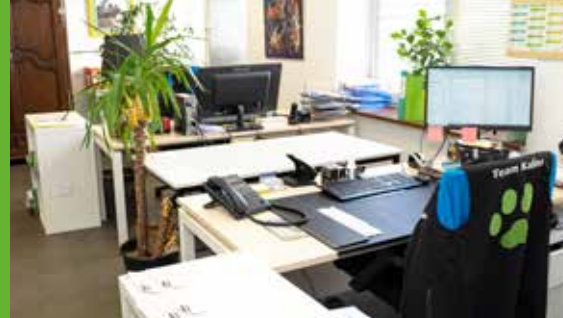
Une équipe administrative

La réussite ne s'improvise pas, elle est le fruit de l'expérience et du savoir-faire d'un véritable partenaire !