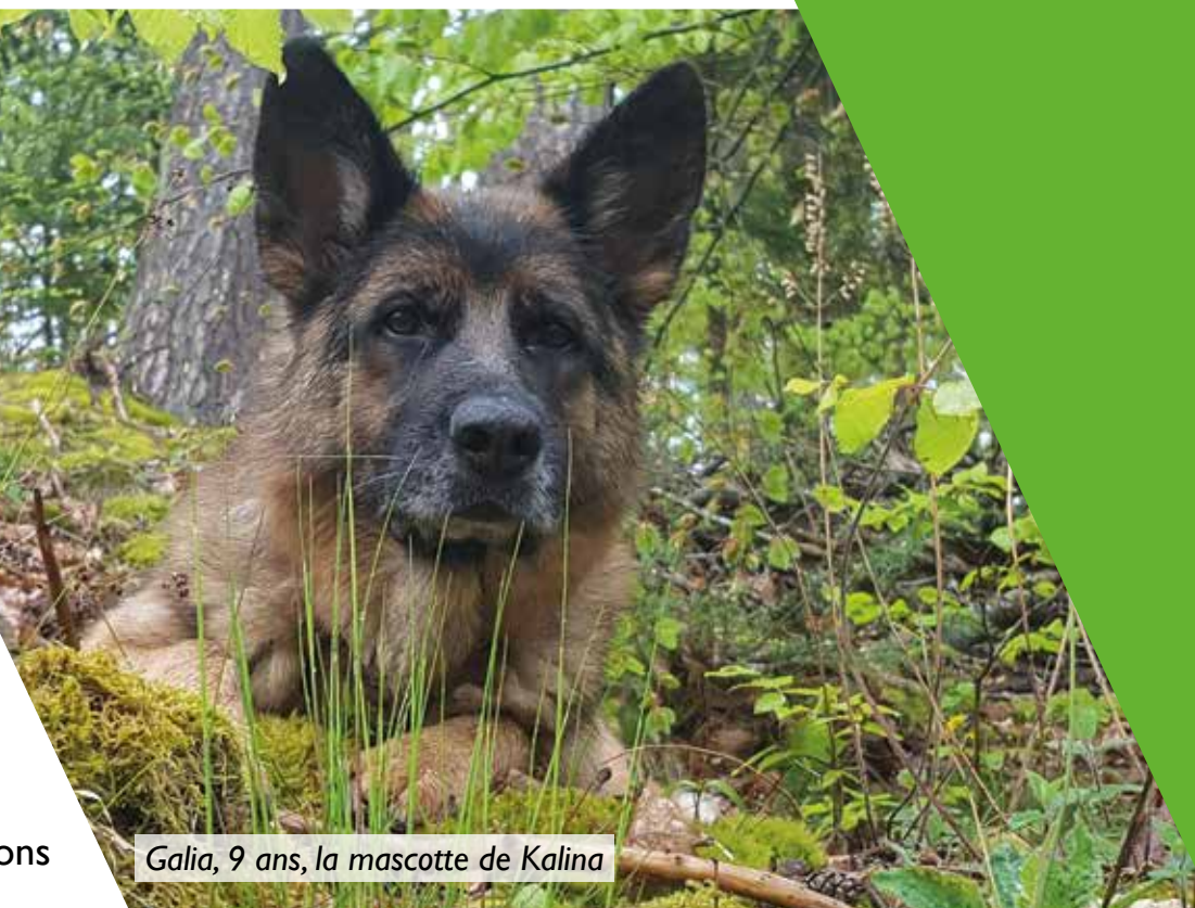
Galia, 9 ans, la mascotte de Kalina

Notre réseau actuel de partenaires, présents sur toute la France, est à la disposition de la clientèle pour proposer des « bons d'essai » et des échantillons gratuits afin de tester tous nos produits. 🐾