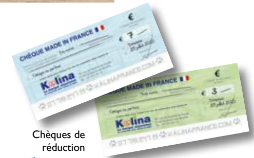
Chèques de réduction