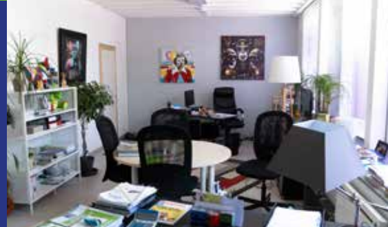
Un point d'accueil et laboratoire commercial