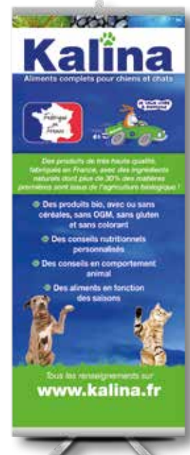
Roll up et drapeau