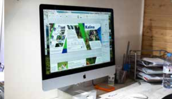
Un studio graphique