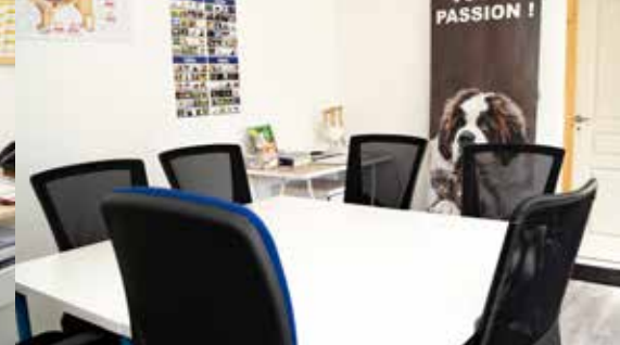
Une salle de formation